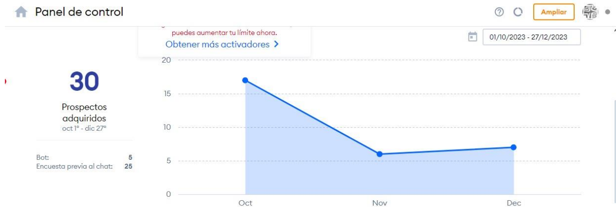
Figura 1 tomado página web https://tenjoculturayturismo.gov.co/

La página web https://tenjoculturayturismo.gov.co/ cuenta con sistema de chats en línea para resolver de manera inmediata las solicitudes de la comunidad arrojando los siguientes resultados.